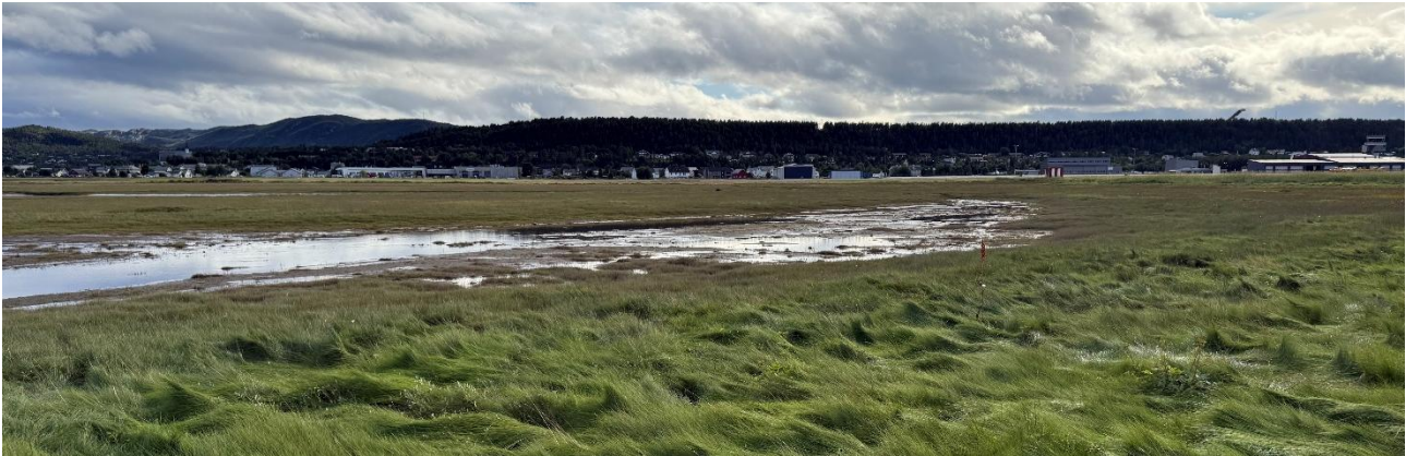
Figur 9. Lufthavnen byr på både kortklippede arealer og lite rovdyr og rovfugler.

er de regelmessige observasjonene av topplerke (RE) som regnes som lokalt utdødd i Norge. Den er sett en rekke ganger i 2025 og er angitt å være både stasjonær, næringssøkende og mulig hekkende. I Norge har den aldri vært vanlig, og er kun kjent fra et fåtalls steder, hovedsakelig på Østlandet. Ut over et hardt klima likner flyplassen godt på prefererte leveområder som gjerne er tørre enger og skrotemarker med sparsom vegetasjon.