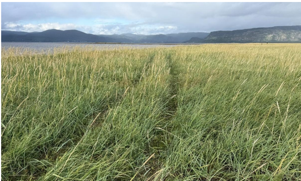
Figur 4. Oppe på ryggen av Naustneset er det strandrug som dominerer, men med rikelig med strandflatbelg nede i vegetasjonen. Det var en del kjørespor i området.

Over på innsiden av neset var det det langt mer artsrike områder. I sonen mellom strandrugen og de fuktigere engene var det flere små åpne enger hvor det vokste en hel del karplanter. Her ble blant annet fjæresøte, fjæresaulauk, ugrasarve, øyentrøst, jåblom og strandkjempe funnet. Videre ned mot vannkanten og ut i strandsonen vokste blant annet den rødlistede arten eskimomure (NT), russeteppesaltgras (NT), strandkryp, ulike saltsiv (potensielt rødlistede) og saltbendel. Disse områdene ble vurdert til å være de mest spesielle da slike skjermete fuktige strandenger ikke er så vanlige i Finnmark. Videre innover mot flyplassen, hvor terrenget var lavere, fantes de virkelig store og våte engene. Disse er utenfor tiltaksområdet og må ikke røres i anleggsarbeidet.