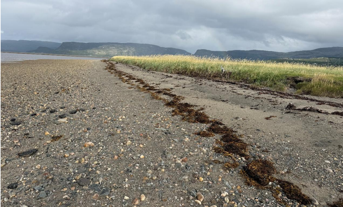
Figur 3. På yttersiden av Naustneset var det grovere sand og grus som gikk over i etablerte strandrugenger.

Strandengen var tydelig sonert fra de mer saltvannspåvirkede og værutsatte områdene ut mot havet hvor stranden besto av grovere sand og grus. Her vokste strandarve og tangmelde hvorav den første dekket store arealer. Østersurt (NT) ble funnet fåtallig.