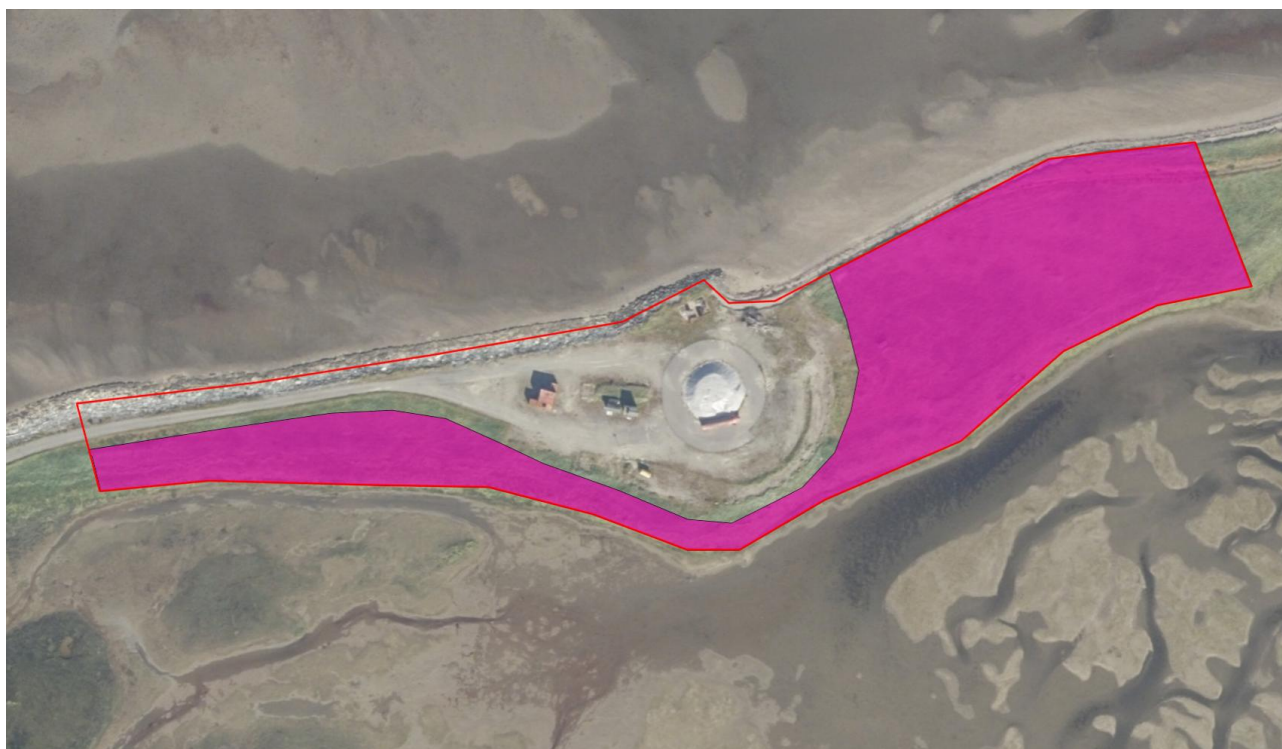
Figur 2. Store deler av Naustneset består av strandenger (rosa). Strandenger er en artsrik naturtype med forekomst av en rekke sjeldne og verdifulle arter. Strandenger er oppført på rødlista for naturtyper som Sårbar (VU). Rødt omriss markerer område for kartleggingen som ble utført i august 2025. Selve brannøvingsfeltet sentralt ble utelatt fra kartleggingen.

Kartleggingsgrensen var bevisst satt i overgangen mellom «tørt land» og mudderflatene på innsiden og havet på utsiden (Figur 2). Særlig mudderflatene på innsiden av Naustneset vurderes til å være svært verdifulle med potensial for funn av en rekke rødlistede arter.