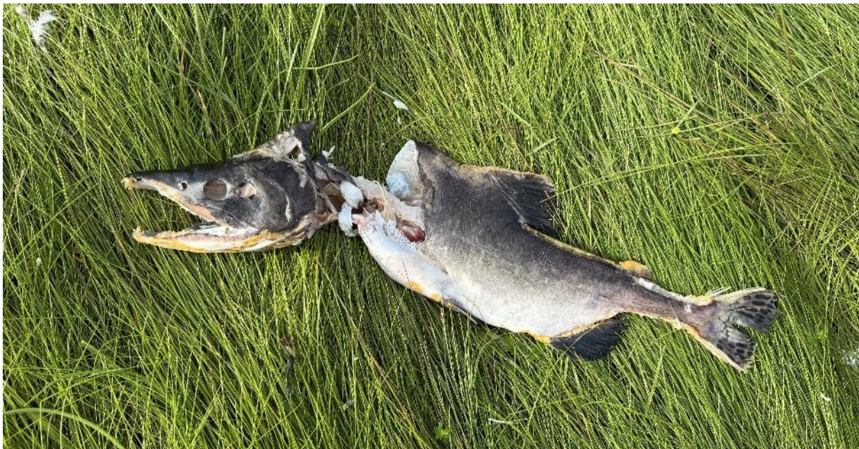
Figur 6. En rekke steder ble det funnet pukkellaks selv langt oppe på engene på Naustneset.

Som en liten kuriositet bør man på sikt se på om ikke pukkellaks-gjødslende enger bør bli en naturtype. En rekke steder over hele Naustneset lå det mer eller mindre oppspiste og råtnende pukkellaks. Og langt inne på de oversvømte engene svømte døende laks rundt på grunt vann.