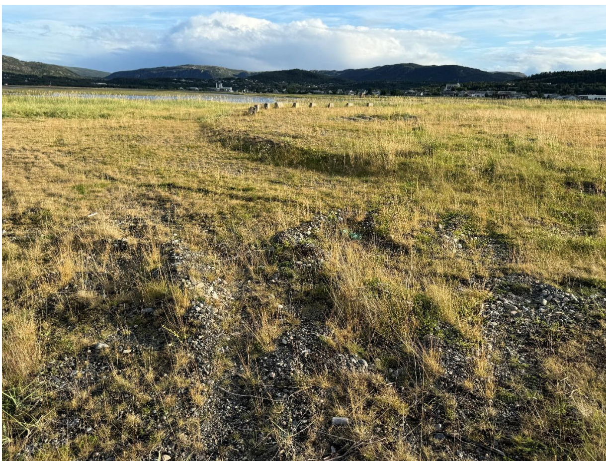
Figur 8. De mest aktuelle hekkeplassene for fugl på Naustneset er trolig de relativt åpne områdene rundt selve brannøvingsfeltet.

Naustneset vurderes til å ha stor verdi som rasteområde for fugl under vår- og høsttrekk og noe verdi som hekkeområde.