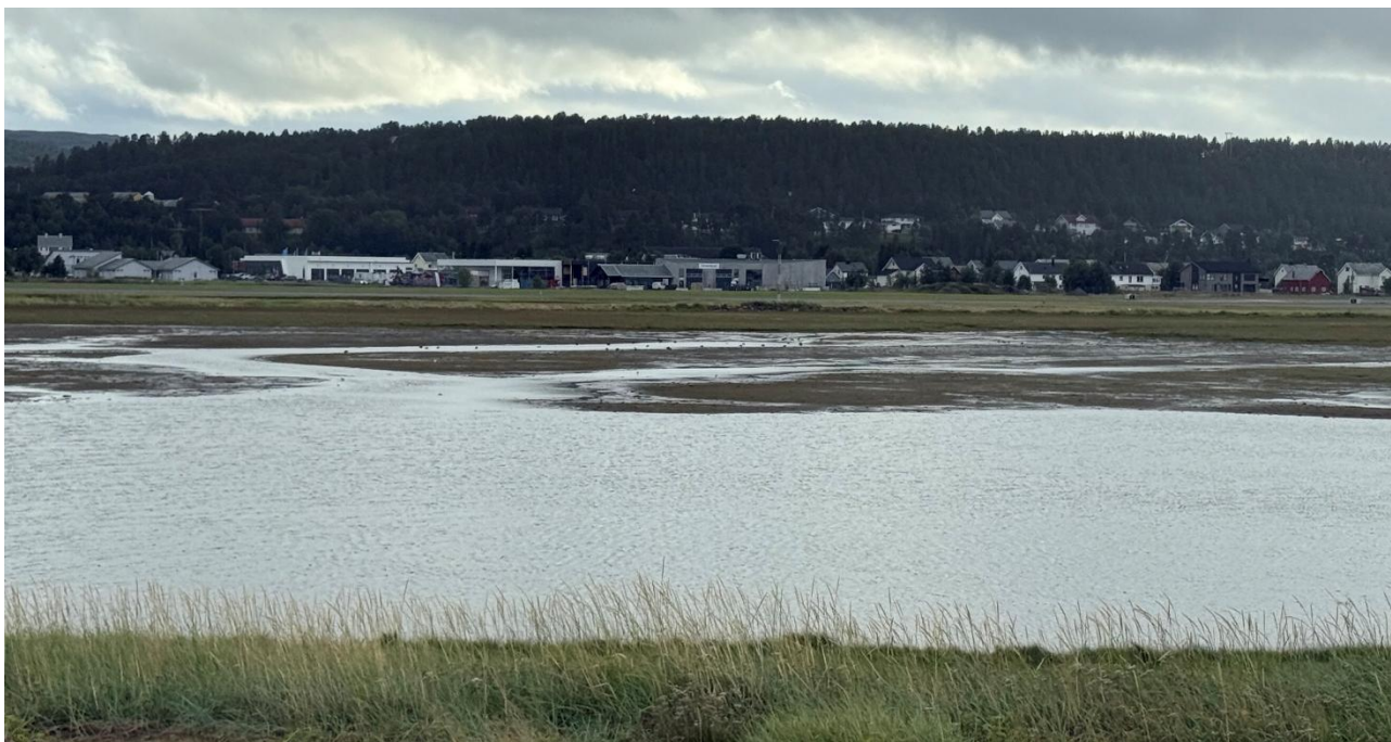
Figur 7. Tilsynelatende en rolig kveld i deltaet, men ved nærmere ettersyn er det hundretalls vadefugler som beiter i ro og mak ute på mudderflaten.

De store grunne mudderflatene utgjør et svært godt beiteområde for måker, ender og vadefugl med store mengder byttedyr, og de mange mindre øyene som ligger i deltaet – med Rørholmen som den viktigste - er både gode beite- og hekkeholmer for flere arter gjess og gressender. Av flere arter er det verdt å nevne tundrasædgås (VU) og dverggås (CR) som sjeldne, truede og forvaltningsrelevante arter. Ute i mer åpne områder er det rikelig med dykkender og området utmarker seg som et særlig viktig overvintringsområde for disse. Området vil etter M-1941 få Svært stor verdi .