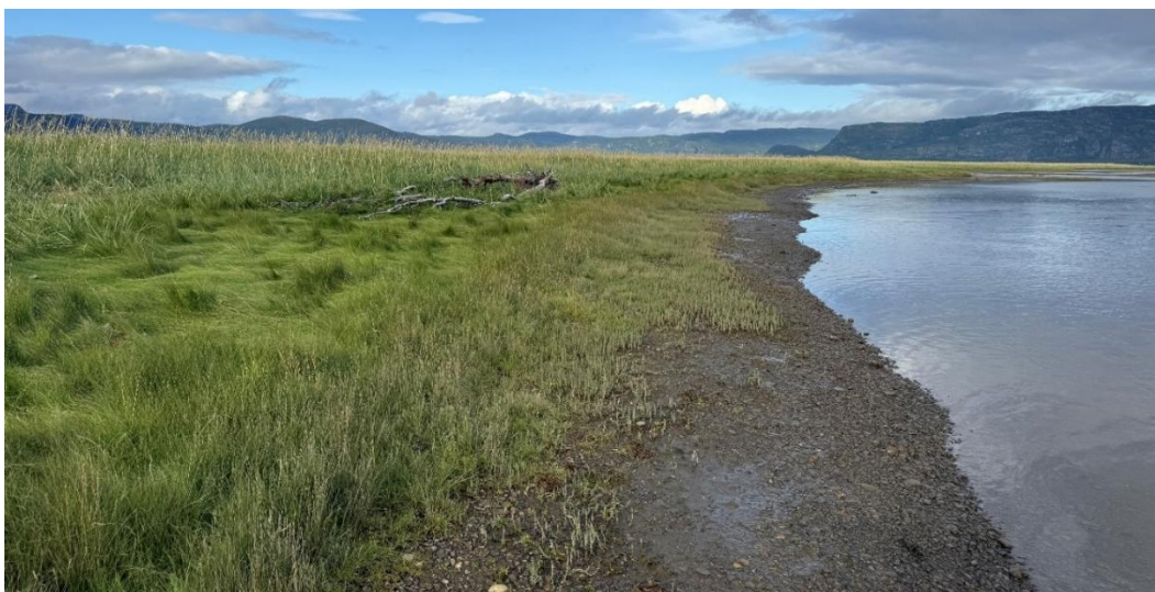
Figur 5. På innsiden av Naustneset var de mest artsrike engene med forekomst av rødlistede arter.

Over på innsiden av neset var det det langt mer artsrike områder. I sonen mellom strandrugen og de fuktigere engene var det flere små åpne enger hvor det vokste en hel del karplanter. Her ble blant annet fjæresøte, fjæresaulauk, ugrasarve, øyentrøst, jåblom og strandkjempe funnet. Videre ned mot vannkanten og ut i strandsonen vokste blant annet den rødlistede arten eskimomure (NT), russeteppesaltgras (NT), strandkryp, ulike saltsiv (potensielt rødlistede) og saltbendel. Disse områdene ble vurdert til å være de mest spesielle da slike skjermete fuktige strandenger ikke er så vanlige i Finnmark. Videre innover mot flyplassen, hvor terrenget var lavere, fantes de virkelig store og våte engene. Disse er utenfor tiltaksområdet og må ikke røres i anleggsarbeidet.