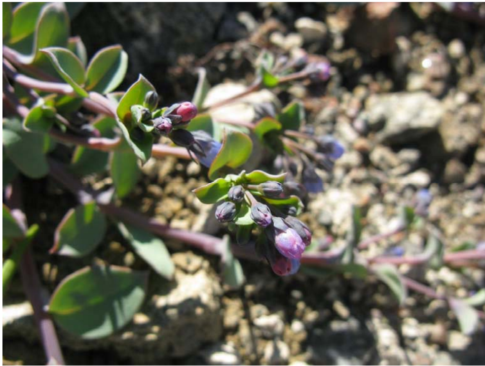
Figur 3. Østersurt er en vakker strandplante.