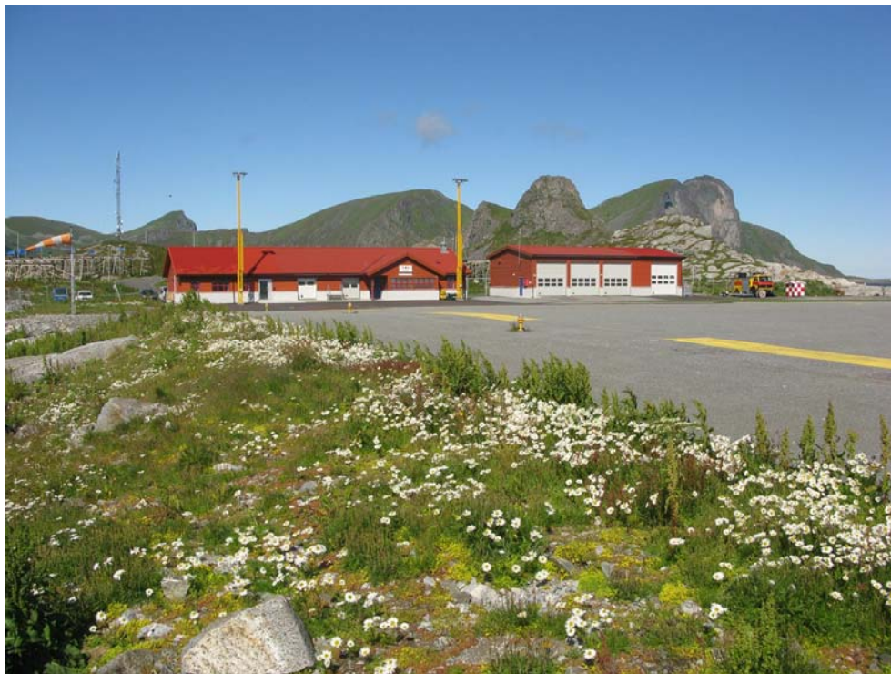
Figur 2. Værøy helikopterbase med skrotemark på utfylte masser.

Ingen verdifulle naturtyperlokalteter ble påvist innenfor undersøkelsesområdet. Helikopterbasen består av en asfaltert flate med utfylte masser på sidene hvor «ugressvegetasjon» har etablert seg. Denne typen naturareal kalles skrotemark. Mye sjøen er det fattige knauser med noen strandplanter registrert på strandberg og i sprekker i knausene. Av arter knyttet til skrotemark er det registrert vassarve, ugressbalderbrå, rød jonsokblom, gjetertaske, ubestemt høymole, fuglevikke, krypsoleie, rødsvingel, tungras, timotei, tunbalderbrå m.flere. Av strandplanter er det registrert østersurt, gåsemure, rødsvingel, strandnellik, strandkjempe, skjørbuksurt, ugressbalderbrå, bitter bergknapp, strandkvann, strandrug, tangmelder m.fl.